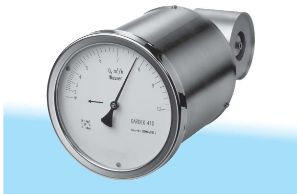
Fig. 1 Débitmètre F I Gardex